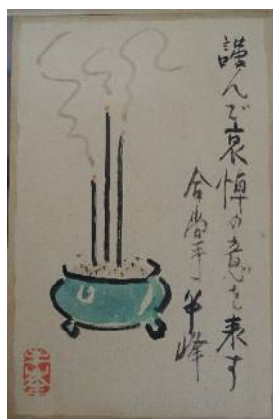
写真 7 西田半峰葉書

平沼亮三が昭和三十四年二月十三日に没した際に、第八回文展（大正三年）で入選を果たした画家、西田武雄（半峰）から弔意を示す葉書が遺族に届けられた。（写真 7）