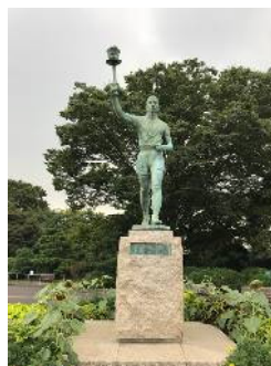
写真2 三ツ沢公園の銅像